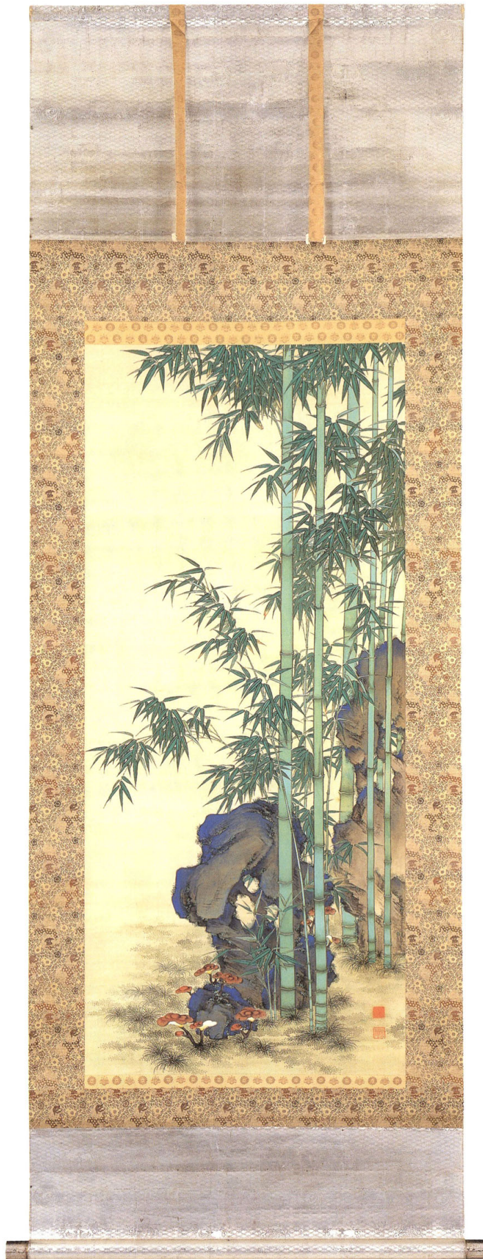
70—野口小蘋《緑竹園》一幅 明治27年(1894) 絹本着色 193.0×84.8